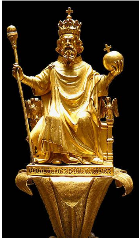
Buste-reliquaire de Charlemagne

Personnage incontournable de l'histoire de France , Charlemagne a conquis et administré un immense empire qui s'étendit au haut Moyen Âge de l'Europe occidentale à l'Europe centrale .