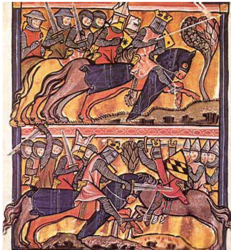
Scène d'après la Vita Karoli Magni manuscrit du XIII e siècle.